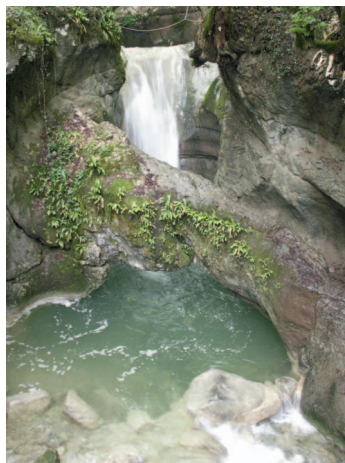
Photo 2 : Arche naturelle, rivière de Savoie