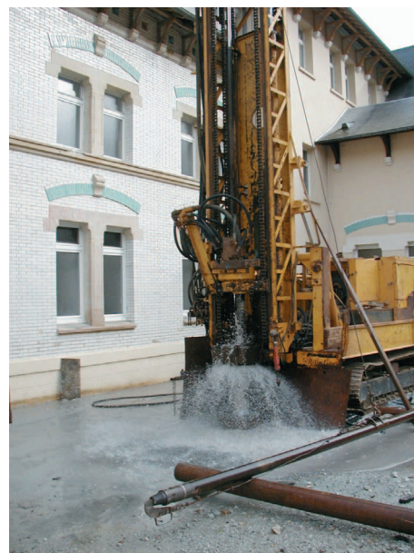
Photo 7 : Forage hydrogéologique

• Définition et mise en œuvre de réseaux de surveillance visant à suivre le niveau des nappes (piézométrie) et/ou la qualité des eaux (ressources en eau, suivi des polluants...). Ces réseaux de surveillance sont conçus en fonction des risques encourus du point de vue des ressources et de l'environnement et avec le souci que les dépenses restent proportionnées aux objectifs d'utilisation.