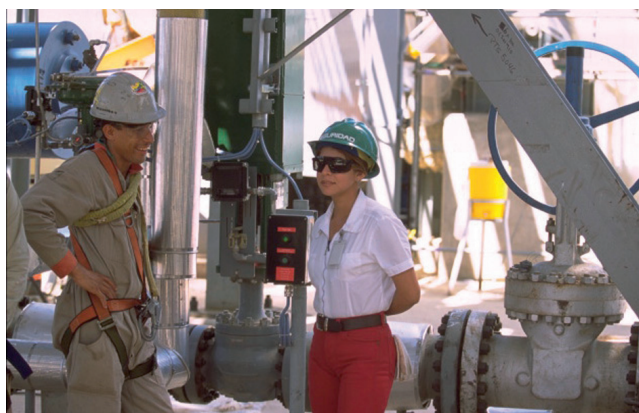
Photo 4 : Forage pétrolier au Venezuela