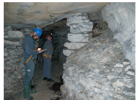
Photo 3 : Surveillance d'une ancienne carrière souterraine