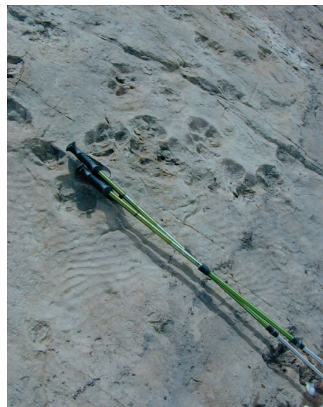
Photo 11 : Empreintes de dinosaures

Les géosciences concourent aussi à la connaissance et à la mise en valeur d'autres patrimoines , notamment historique et archéologique . Ce sont là autant de pôles d'intérêt et de possibilités d'emploi ouvertes aux géologues de demain.