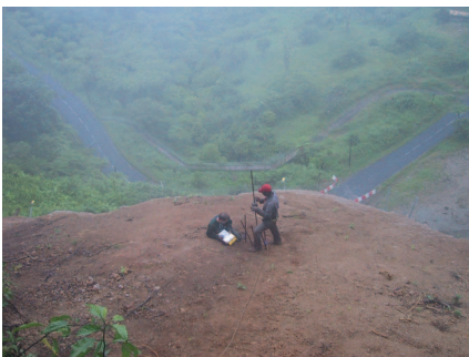
Photo 1 : Mesure géotechnique en forêt équatoriale