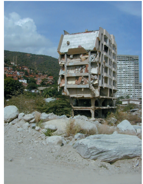
Photo 9 : Glissement de terrain

Prendre en compte les risques naturels dans un programme d'aménagement peut conduire à différentes stratégies : le déplacement du projet quand il est incompatible avec les risques encourus (itinéraires de routes dangereuses, habitations trop proches de rives ou de rivages...), la mise en œuvre de parades (traitement de versants rocheux, dimensionnement et structures adaptés d'ouvrages parasismiques...) ou la surveillance de l'évolution du phénomène (cas des grands glissements de terrain). Dans tous les cas, les choix retenus vont s'appuyer sur des avis où l'appréhension concrète du terrain, dans toute sa complexité naturelle, est essentielle. Et c'est un aspect important du métier des spécialistes des risques naturels que de savoir faire partager les acquis mais aussi les incertitudes inhérentes à la nature de leurs études.