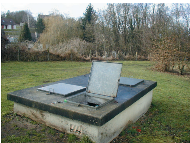
Photo 6 : Surveillance d'eau souterraine (Cliché O.Grière, Géologue conseil)

En contexte rural ou urbain , la bonne gestion des eaux implique de surveiller tout au long de l'année le niveau des nappes (piézométrie), niveau qui varie avec les pluies et l'utilisation plus ou moins saisonnière des eaux. La répartition et la densité des points d'un réseau de surveillance sont à fixer en fonction du type de nappe d'eau. Il en est de même de la périodicité des mesures permettant de suivre l'évolution des impacts de la consommation, les recharges par les pluies, les relations entre les nappes et les débits des cours d'eau, autant d'éléments de choix que les hydrogéologues vont proposer aux collectivités territoriales.