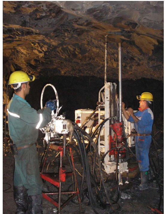
Photo 5 : Chantier d'exploration en souterrain

Dans le domaine des granulats et des pondéreux en général, la pression environnementale et la stratégie de développement durable ont entraîné un élargissement de la palette d'interventions des géologues dans la gestion du foncier et de l'environnement . Prospecteur foncier ou responsable foncier et environnement sont des fonctions aujourd'hui fréquemment remplies par des géologues employés soit dans les sociétés d'exploitation elles-mêmes, soit dans les bureaux d'études travaillant pour elles. Elles font naturellement appel à des qualités de management et de négociation.