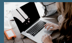
STOCKAGE DE L'INFORMATION